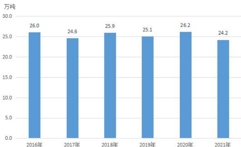
图 2：2016-2021 年粮食产量

全年全区猪牛羊禽肉总产量 18011 吨，比上年增长 107.3%，全年全区猪肉产量 12565 吨，增长 68.4%；牛肉产量 495 吨，下降 12.3%；羊肉产量 102 吨，下降 12.2%；禽肉产